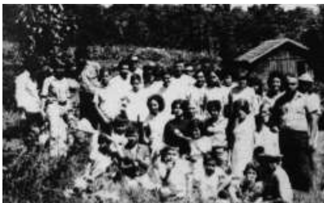
Acampamento dos Jovens.