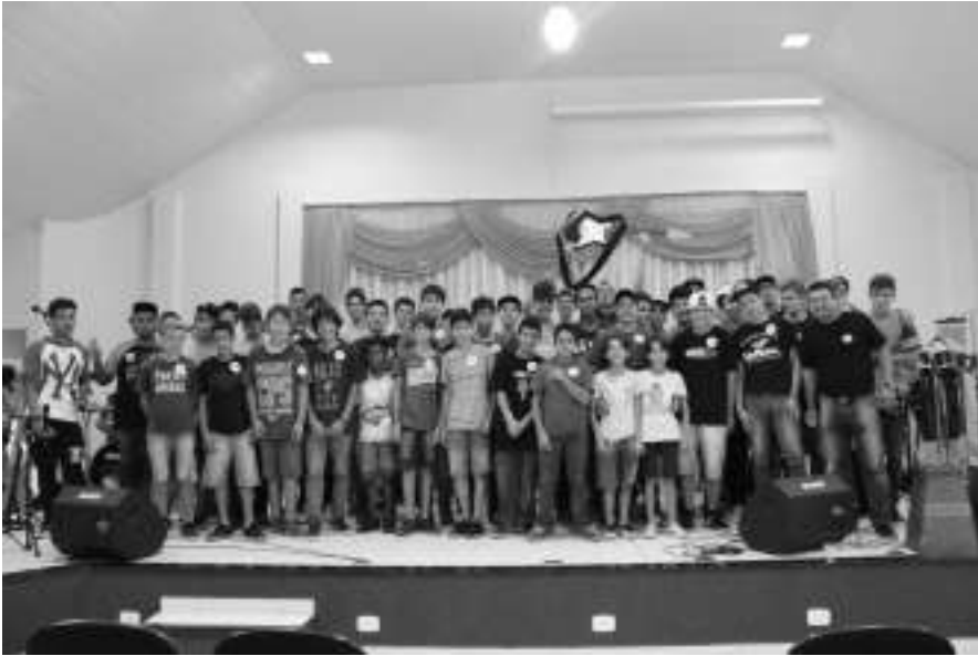
Curso de Música - Art Música - 2017.