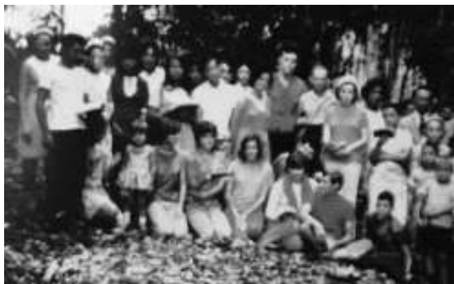
Foto feita logo após sessão, antes do término e inauguração do Novo Templo.