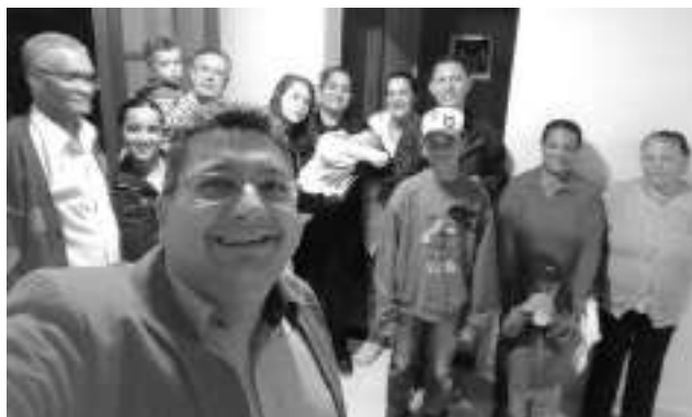
Pequenos Grupos Multiplicadores - 2019.