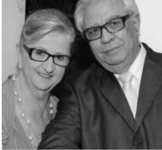
Pr. Osnildo e esposa.